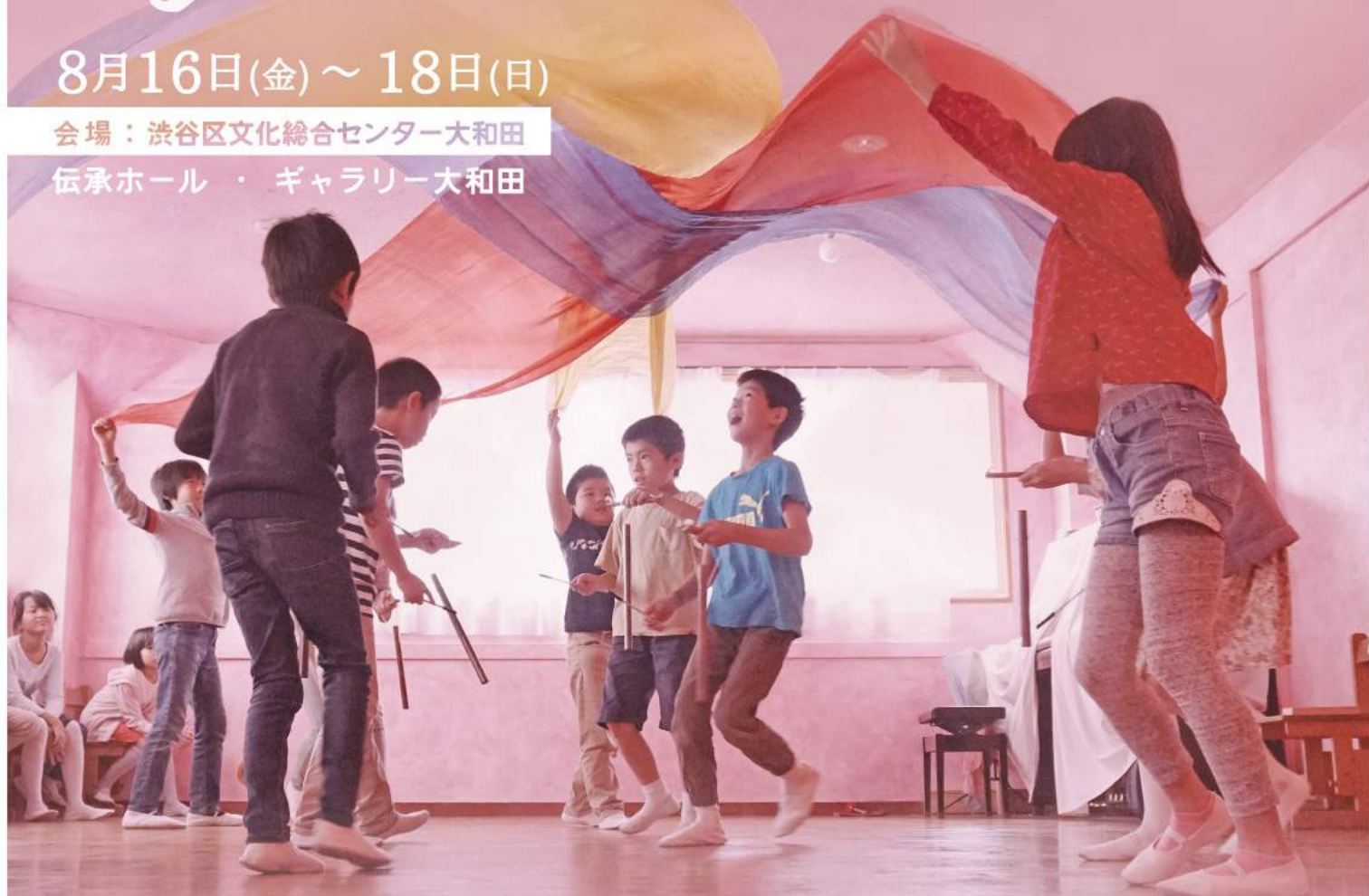
写真：低学年の音楽の授業